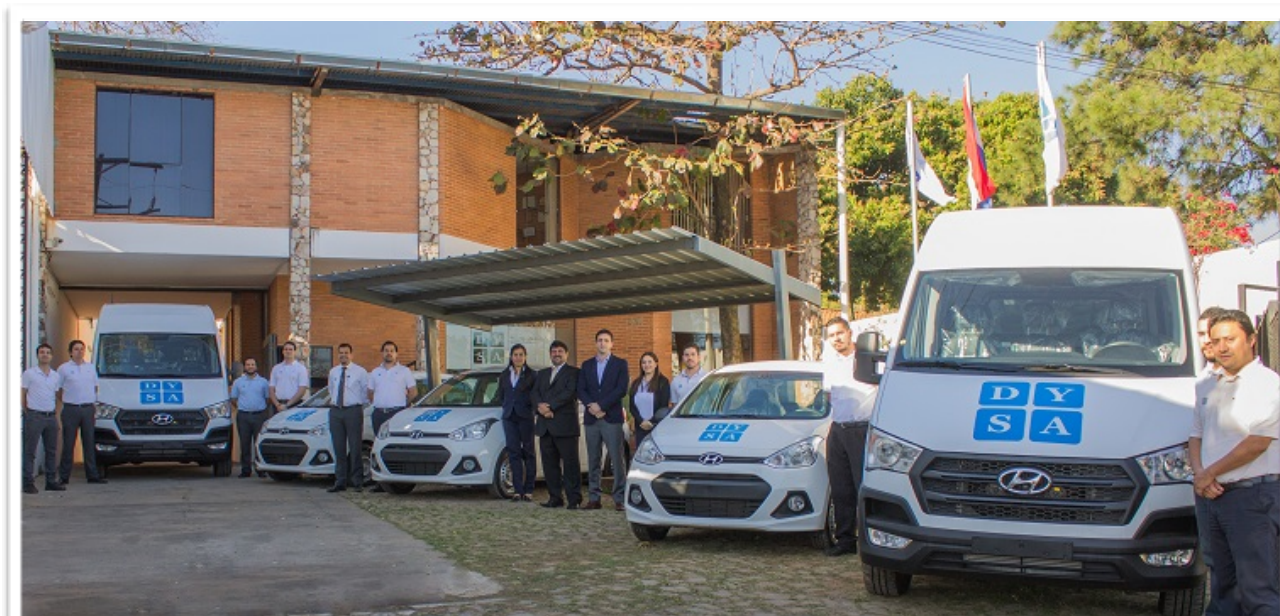
Los nuevos integrantes de la flota de vehículos DYSA: dos furgones Hyundai H350 y tres automóviles Hyundai i10.

Por décimo año consecutivo, DYSA se mantiene como líder en Tecnología Aplicada a la Salud en el Paraguay. Actualmente cuenta con más de 2.000 equipos bajo contrato en todo el territorio nacional y para llegar a todos sus clientes ha ampliado su flota a 16 vehículos, con capacidades de transporte de todo tipo de equipos e insumos médicos.